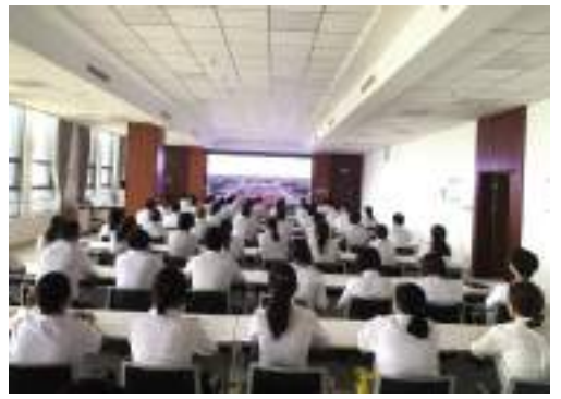
集团党委组织各下属单位集中收看庆祝中国共产党成立100周年大会实况直播 (图为集团机关)。