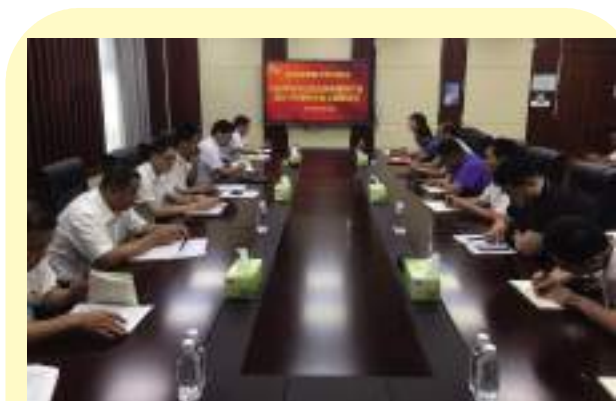
7月1日下午，机关党支部集中学习研讨习近平总书记在庆祝中国共产党成立100周年大会上的重要讲话。(王静)

对于此次活动，老党员们满怀激动，回忆并讲述了自己入党经历，老党员们表示，自己亲眼见证了国家、集团公司几十年的沧桑巨变和取得的辉煌成就，更深切地体会到了“没有共产党就没有新中国”，他们表示，将不忘初心、牢记使命，时刻以一名共产党员标准严格要求自己。