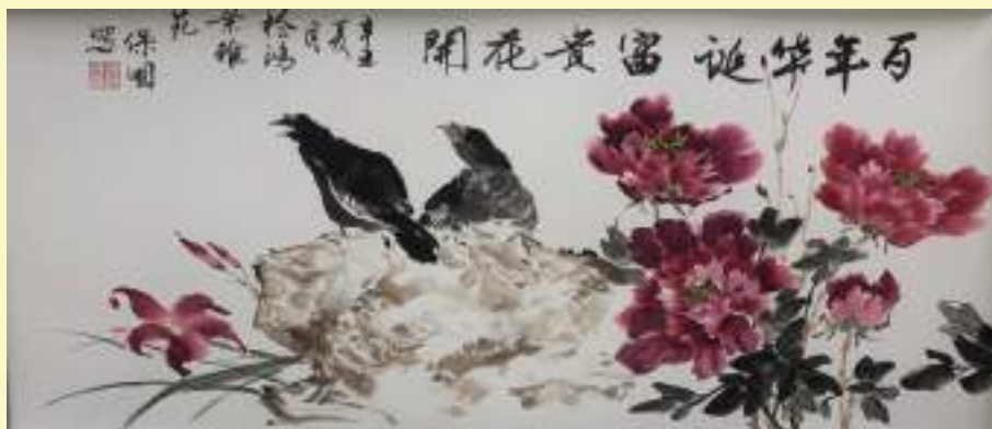
范保国《百年华诞花开富贵》绘画类第二名